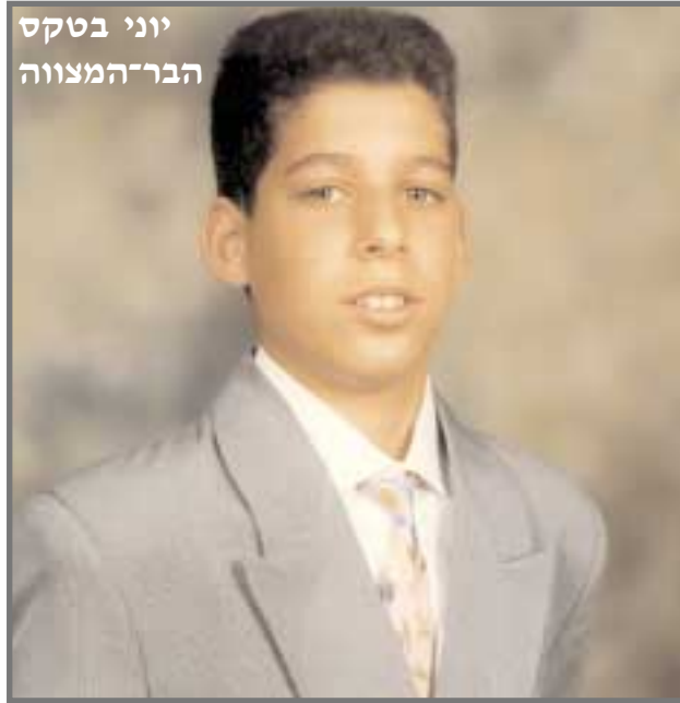
יוני בטקס הבר-המצווה

היהונתן נולד בבית- החולים "וולפסון" להוריו הזל ודניאל. האב, דניאל, נולד בקזבלנקה שבמרוקו ועלה לארץ במסגרת עליית הנוער בעקבות מלחמת ששת-הימים.